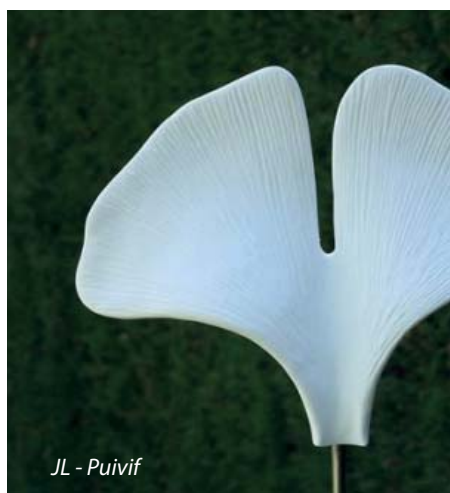
JL - Puivif