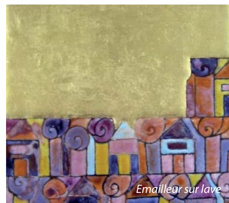
Emailleur sur lave